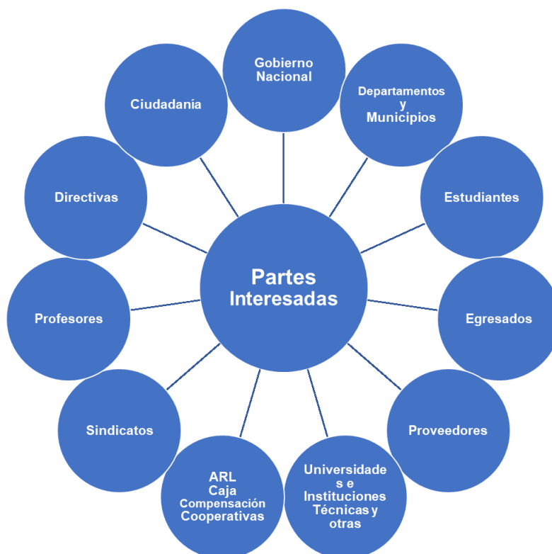
Imagen N° 5 Caracterización partes interesadas Rendición de Cuentas UPN